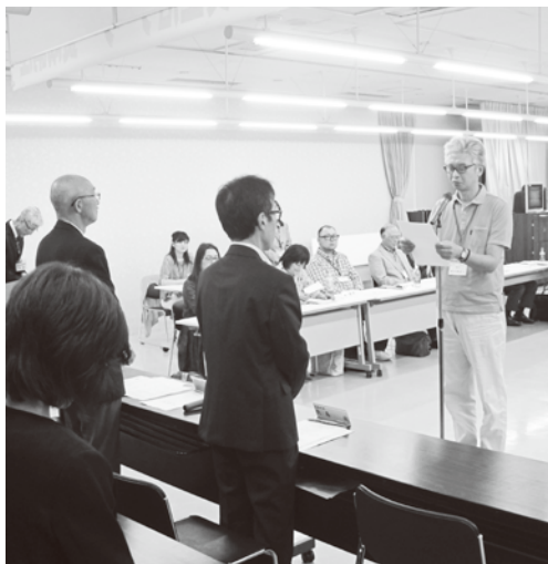
平成30年度消費生活リーダー養成講座の閉講式(記事は5ページ)