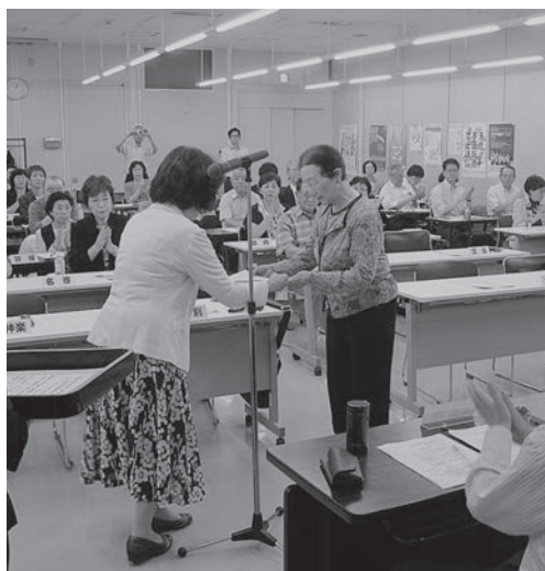
表彰状の伝達 (記事は3ページ)