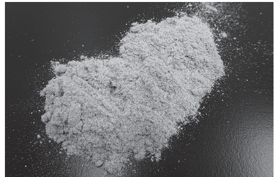
カーペットから出た大量の粉

A. 白い粉を蛍光X線分析装置で分析したところ、カルシウムが大半を占めていたことから、接着剤に使用されている炭酸カルシウムが劣化して析出してきたと考えられます。このようにカーペットから経年劣化した接着剤の白い粉が出る事例が他にも多く報告されています。接着剤は時間経過や光、熱、湿気などで劣化することが知られています。身体に害のある物質ではないので心配はいりません。