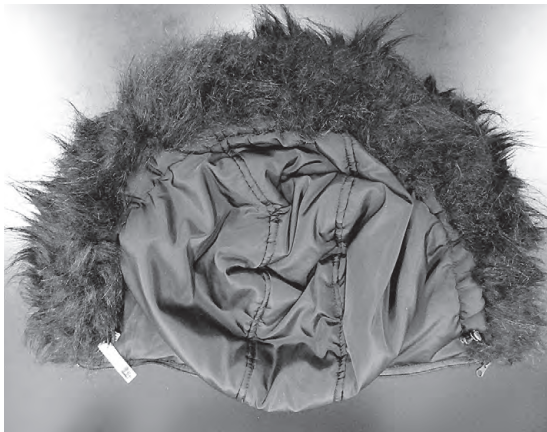
ごわついたファー

A. ファーが部分的に固まりごわついた感触になっていました。繊維の鑑別を行ったところ、アクリルであることがわかりました。アクリルは熱に弱いことから、スチームやタンブル乾燥などの熱仕上げによる収縮やごわつきなどの風合い変化が発生する苦情事例が報告されています。繊維の特性上、熱がかからないようにする取扱の注意が必要です。