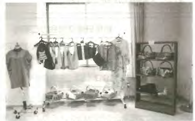
↑リメイク作品・クラフト作品展示