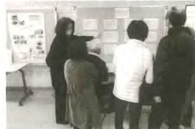
↑消費者力 クイズコーナー