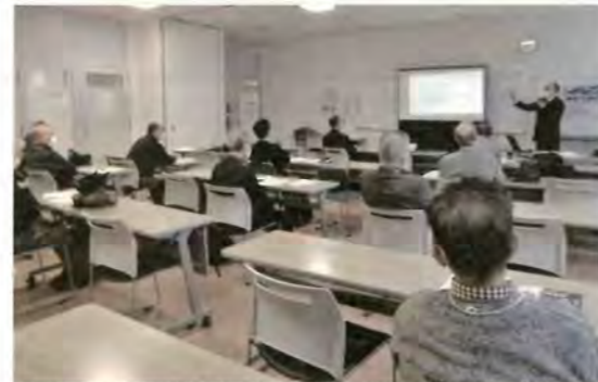
2/2 Men's倶楽部 2月社会時事研究 「高齢者の交通安全を考える」 於:札幌エルプラザ