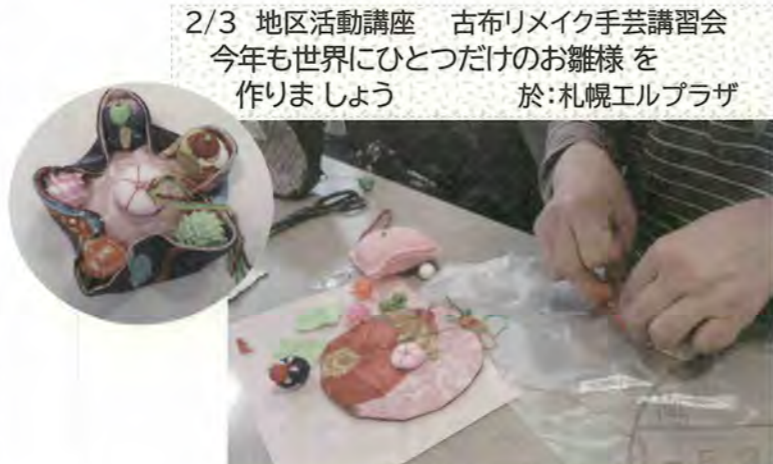
2/3 地区活動講座 古布リメイク手芸講習会 今年も世界にひとつだけのお雛様を 作りましょう 於:札幌エルプラザ