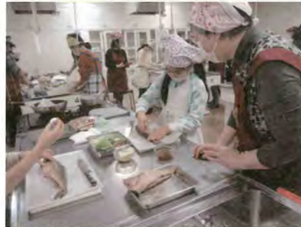
1/7 親子魚料理講習会 於:札幌エルプラザ 親子で チャレンジ ~まるごと魚を食べちゃうぞ! 共 催:札幌市中央卸売市場水産協議会