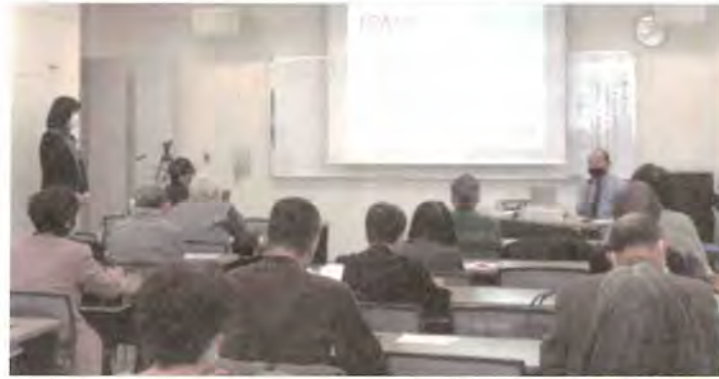
1/26 消費生活講座 主催:札幌市消費者センター インターネット被害者にならないために 於:札幌エルプラザ

編集発行 公益社団法人 札幌消費者協会 TEL: 011-728-8300 / FAX: 011-728-8301 〒060-0808 札幌市北区北8条西3丁目札幌エルプラザ2F https://www.sapporo-shohisha.or.jp/