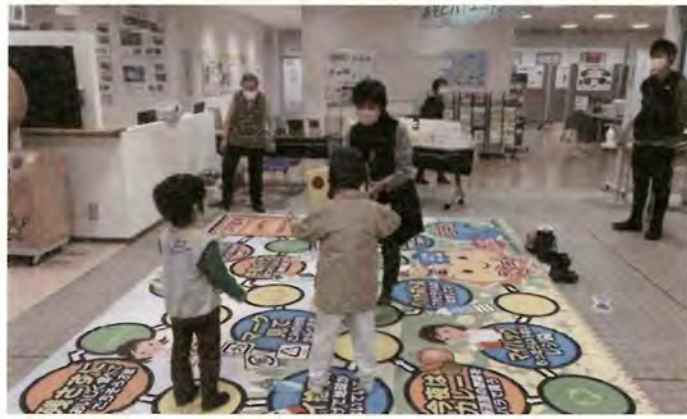
2/11 あそびバ! エコプラザ 環境研究会 於:札幌エルプラザ