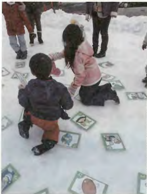
2/18 リユース冬まつり 環境研究会 「雪中かるた」 於:札幌リユースプラザ