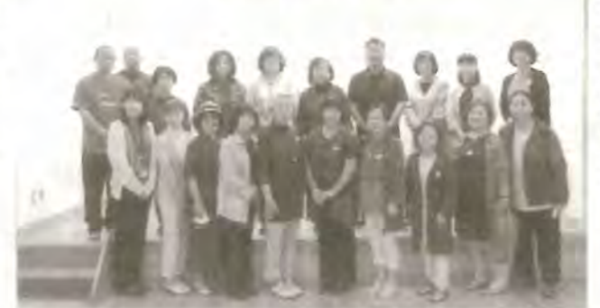
講師の皆さんと一緒に