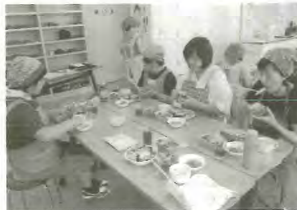
↑出来上がった料理を熟食で試食