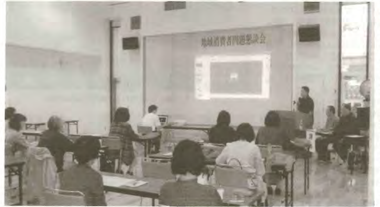
講師左から 栗山義隆氏 菊地雄介氏 関米浩氏

雄武町で開催の標記懇談会に、町の多目的バスの利用と担当主事の同行を得て、総勢 17 名で参加しました。雄武町長の歓迎を賜り、その後のセミナーでは「牧草の力自然のおいしさ」とのテーマで 3 人の講師の方からお話しを伺い、「グラス(牧草)フェッド(食物)」「カラービーフ」など初めての言葉に出会いました。