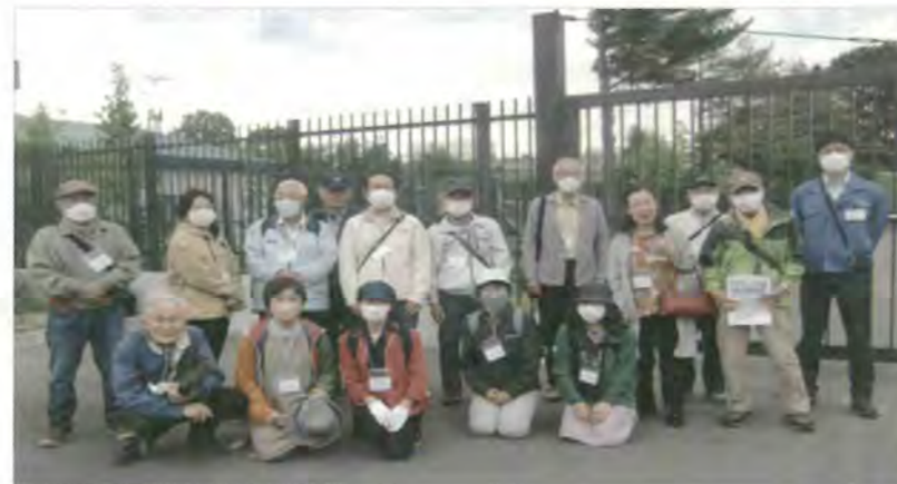
6/2 Men's倶楽部オープン講座 社会時事研究 平岸水力発電所見学会