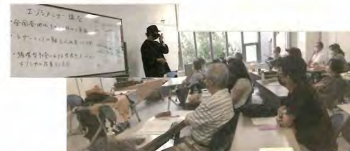
7/30 北海道エゾシカ倶楽部講座 「どっちがいいの？」 ビーガンレザー&ジビエレザー 於：札幌エルプラザ