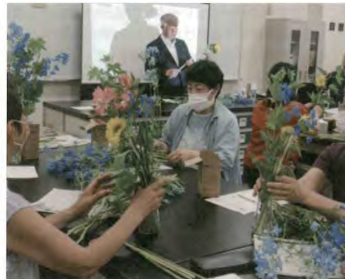
7/5 地産地消応援講座 「北海道産花きの生産と消費」 於：札幌エルプラザ

TEL: 011-728-8300 FAX: 011-728-8300 〒060-0808 札幌市北区北8条西3丁目札幌エルプラザ2F https://www.sapporo-shohisha.or.jp/