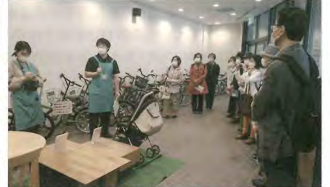
6/9 地区活動部講座 「リサイクルプラザ宮の沢見学会」 於：ちえりあ1階