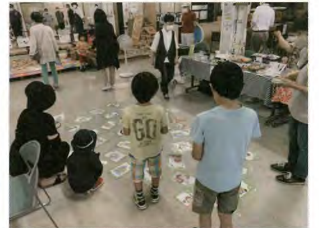
7/15 リユースプラザ夏まつり 「大かるた大会」 環境研究会 於：札幌市リユースプラザ