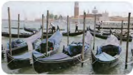
「ヴェネチアの思い出」(豊平区 みちこ)

***** 編集後記 ***** メジャーリーグで大活躍中の大谷翔平選手はグラウンドのごみ拾いをしているという。彼自身は「僕は人が落とした運を拾っているだけ・・・」と言っているとか。この行為はチームメイトのトラウト選手やアメリカの野球少年たち・観客にまで良い影響を与え、このグラウンドを綺麗にしようという運動は次第に広がりを見せている。プレイや成績だけではなく彼の人間性や行動は「日本の宝」と称賛しながら、毎日テレビで応援している。(射水美知子)