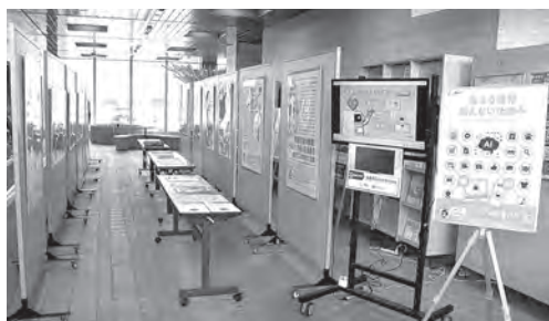
5月の消費者月間パネル展 = 5月21日、北海道本庁舎特設展示場