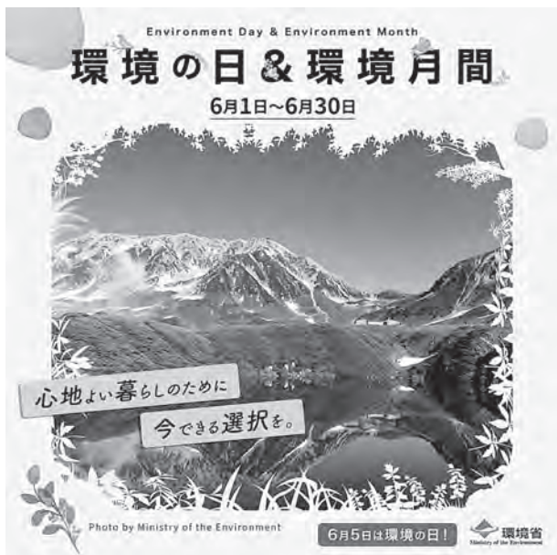
環境省のポスター

6月5日は環境の日です。1972年にストックホルムで開催された「国連人間環境会議」を記念して定められました。日本では6月の1カ月間を環境月間としています。この機会に環境問題について考えてみませんか。